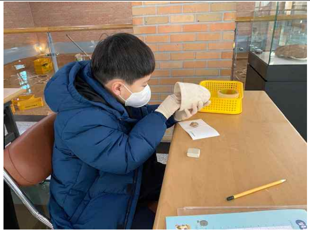
<우리동네 고고학자> 활동사진