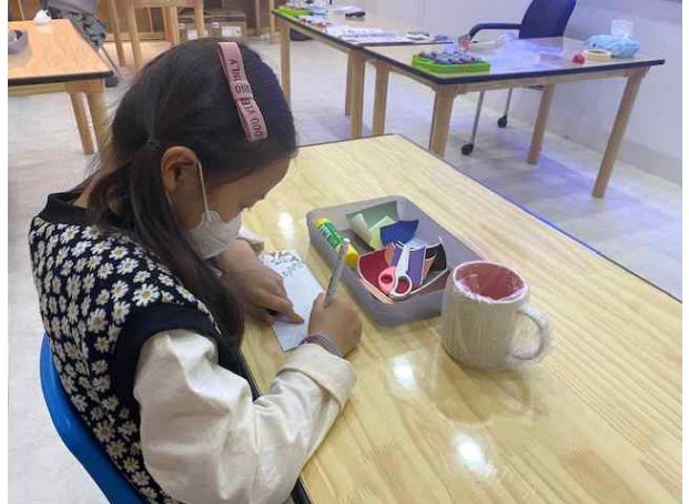
<내 손 안의 선사> 활동사진