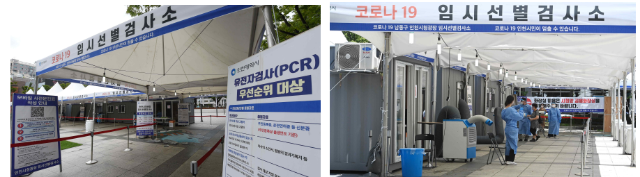
< 인천시청 앞 광장 임시 선별검사소 사진 >

김문수 시 감염병관리과장은 “태풍 복상으로 인한 피해를 최소화하기 위해 임시 선별검사소 운영을 부득이 일시 중단하기로 한 만큼 PCR 검사를 받을 분들은 불편하더라도 보건소나 민간 의료기관 선별진료소를 이용하시기 바란다”고 당부했다.