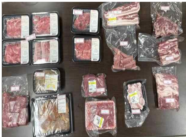
돼지고기 원산지 검정 품목(적합)