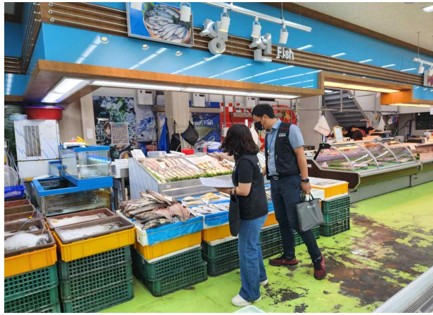
마트 내 수산물 코너 원산지 단속 현장