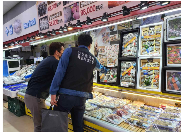
식자재마트 내 수산물 선물용품 원산지 표시 위반