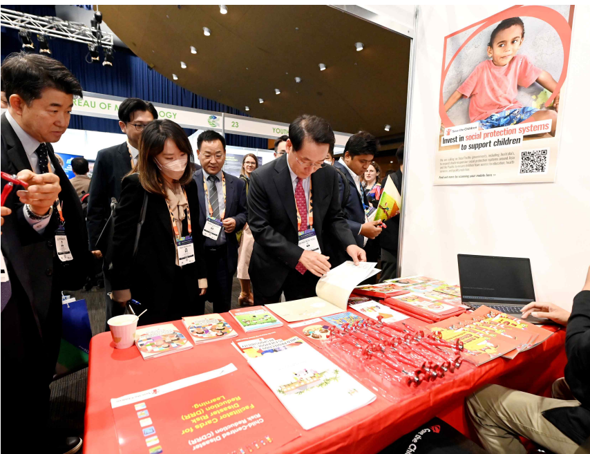
▲ 유정복 인천광역시장이 20일 호주 브리즈번에서 열린 '제9차 아시아·태평양 재난위험 경감 각료회의(APMCDRR) 개막식'을 마친 뒤 해외 전시관을 둘러보고 있다.