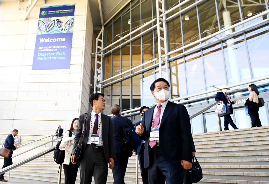
▲ 유정복 인천광역시장이 20일 호주 브리즈번에서 열린 '제9차 아시아·태평양 재난위험 경감 각료회의(APMCDRR) 개막식'에 참석하고 있다.

※ 그 밖의 사진은 인천시 홈페이지 '인천시 인터넷방송'( http://tv.incheon.go.kr/ ) '포토인천'에 게시되어 있습니다.