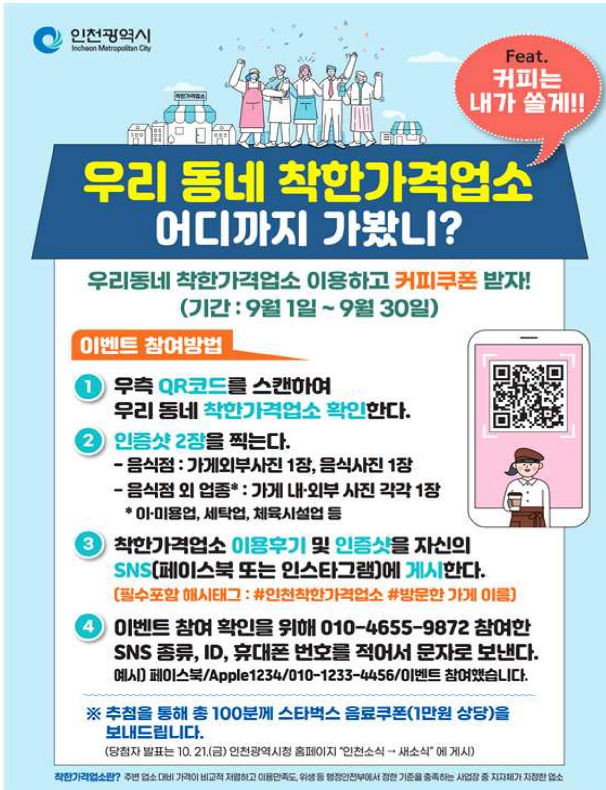
▲ 착한가격업소 SNS 이벤트 홍보 포스터