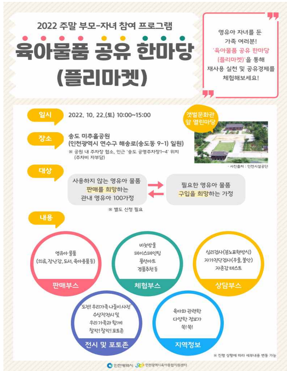
(사진) 육아 물품 공유 한마당(플리마켓) 안내문