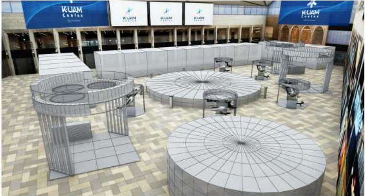
① 전시장 전경

파라다이스 시티 호텔 플라자가 광장을 전시 공간으로 조성 전시공간에 공공기관, 학계, 기업을 유치하여 미래 UAM 산업 콘텐츠 (기체, 버티포트, 통신, 서비스등) 전시