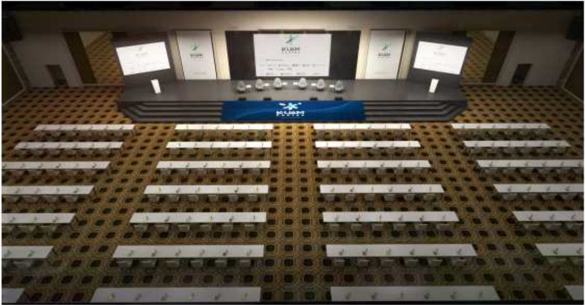
① 컨퍼런스장 전경

파라다이스 시티 호텔 그랜드볼룸 공간은 국제 컨퍼런스장으로 구성 국제 컨퍼런스 규모에 맞게 무대 및 좌석 배치 구성, K-UAM Confex 키비주얼을 이용한 Display