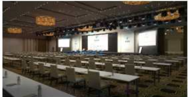
③ 컨퍼런스장 전경