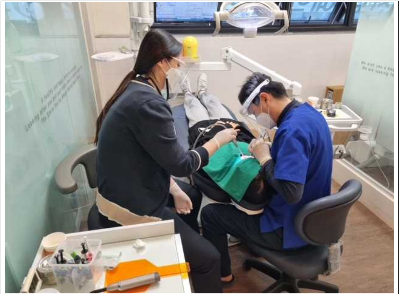
[붙임3] 아동 치과주치의 관련사진