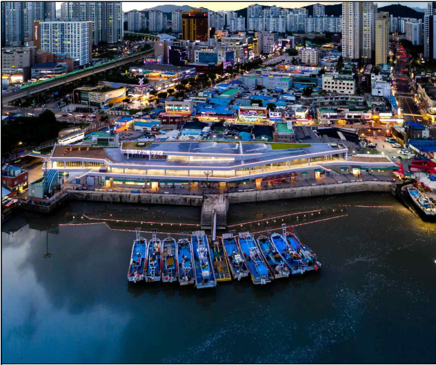
소래포구 전통어시장 외부 전경