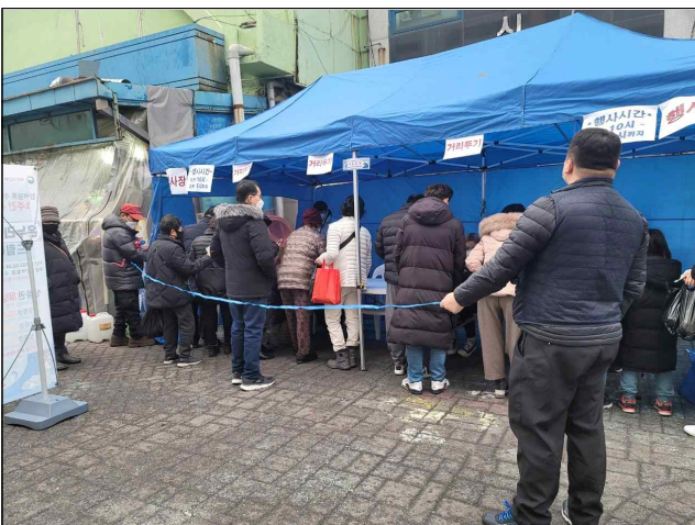
설명절 행사 전경(연안부두 인천종합어시장)