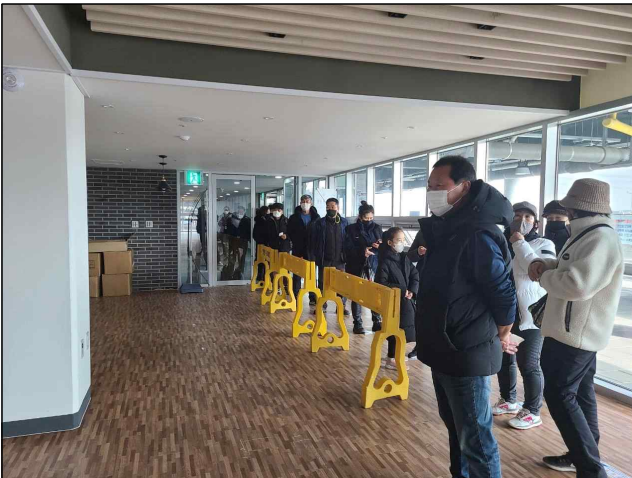
설명절 행사 전경(소래포구 전통어시장)