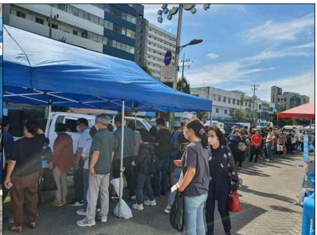
추석명절 행사 전경(연안부두 인천종합어시장)