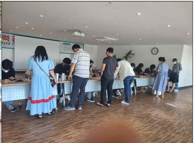
추석명절 행사 전경(소래포구 전통어시장)