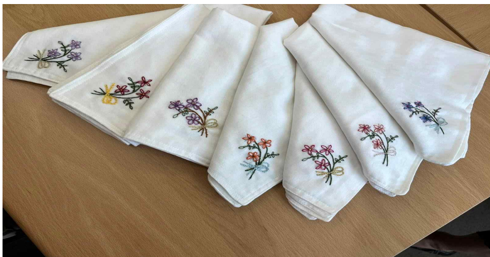
유족 자조모임이 만든 작품