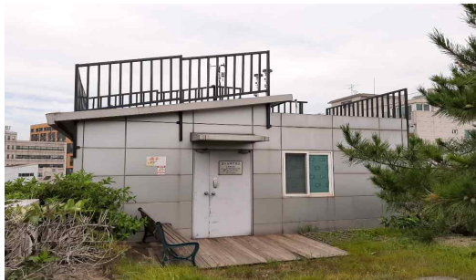
< 미세먼지 측정소 >