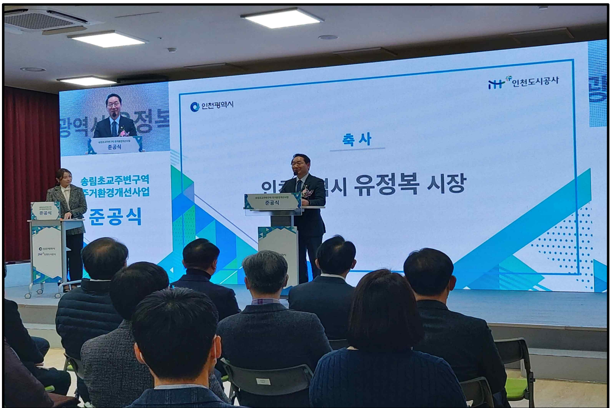
유정복 인천광역시장 축사