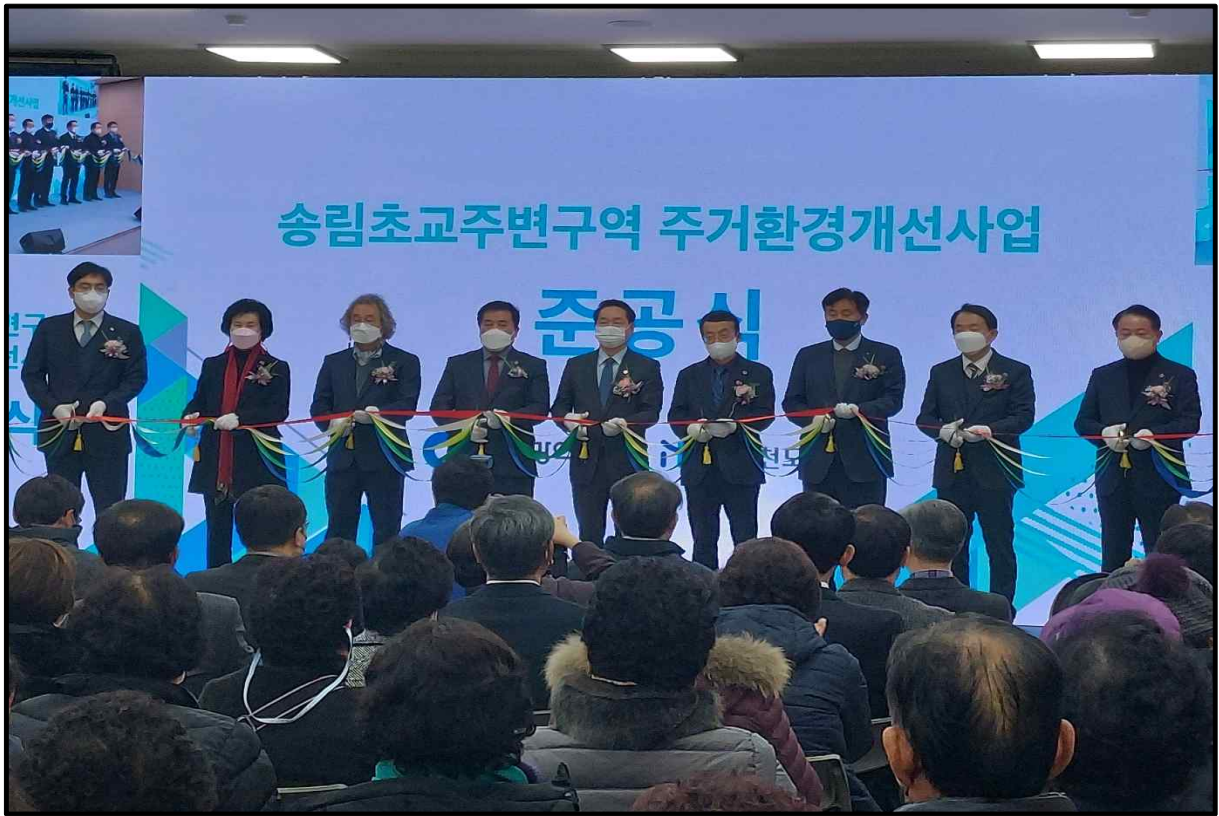
2022.12.12. 송림초교주변구역 주거환경개선사업 준공 컷팅식