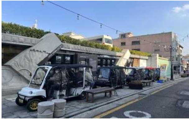
개항장 현장체험 (개항e지투어)