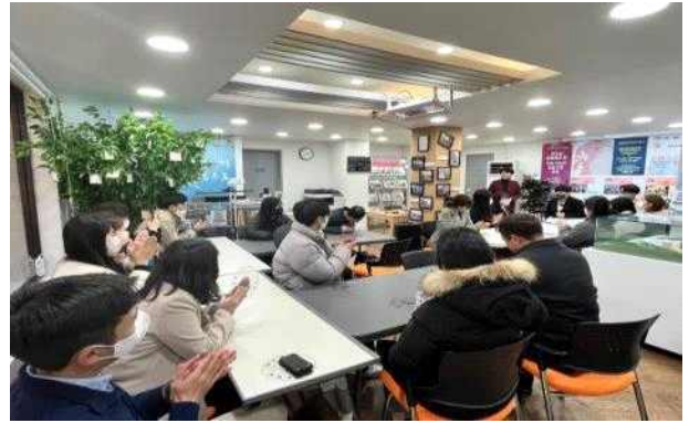
제물포르네상스 프로젝트 바로알기