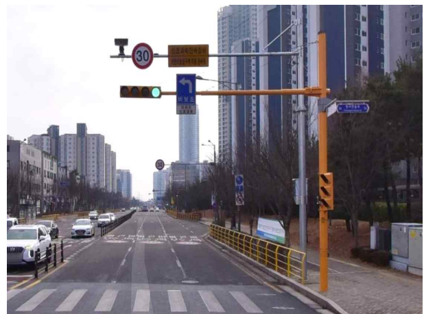
▲ 무인단속카메라 설치