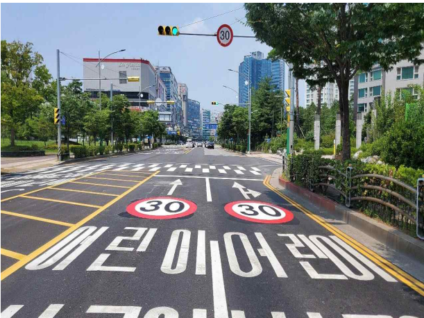
▲ 어린이보호구역 노면표시