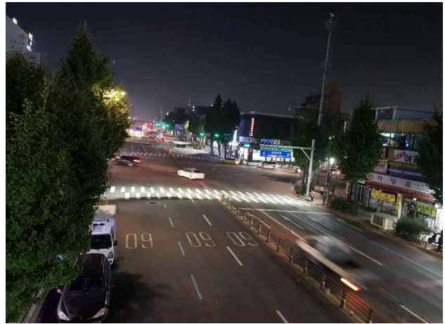
▲ 횡단보도 투광기 설치