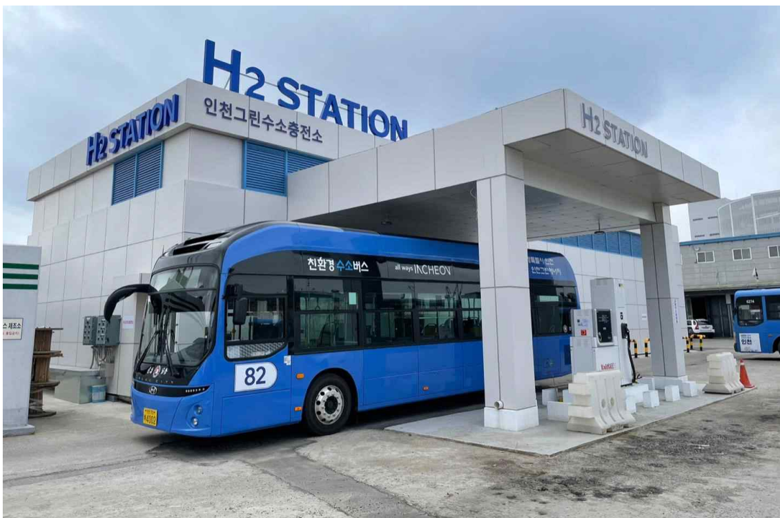
▲ 중구 신흥동 ‘인천그린수소충전소’