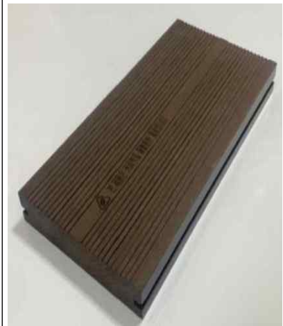
커피박 제품 (데크)