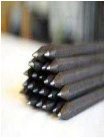
커피박 제품 (연필)