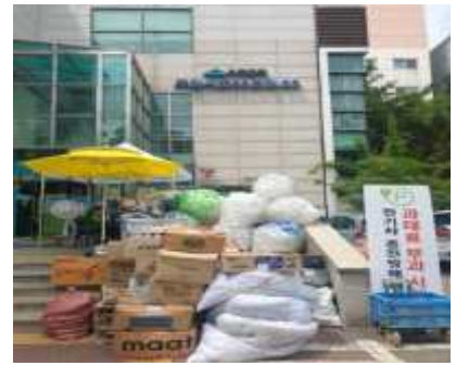
인천자원순환가게 운영 사진