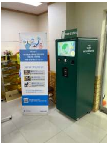
ICT 다회용컵 무인반납기