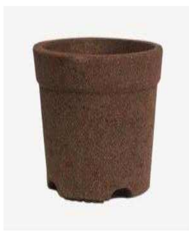
커피박 제품 (화분)