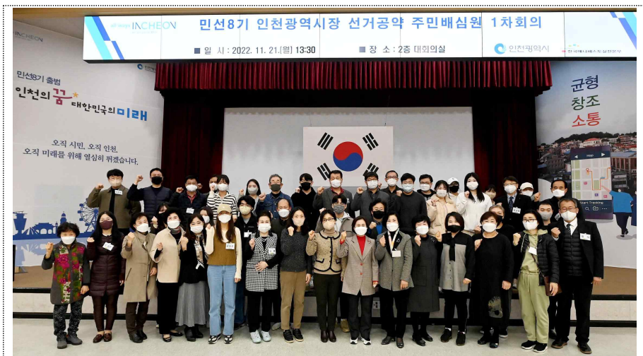
<인천시는 지난 11.21. 선거공약 주민배심원(주관: 한국매니페스토실천본부) 50명을 위촉했다.>

인천광역시 관계자는 “시민평가단의 활동을 통해 인천광역시장의 공약이 어떻게 추진되는지를 직접 점검하고 평가함으로써 공약 이행과정의 투명성과 공약실천의 완성도를 크게 높여 나갈 수 있을 것” 이라고 말했다.