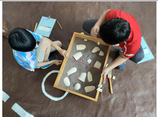
<우리동네 고고학자> 활동사진