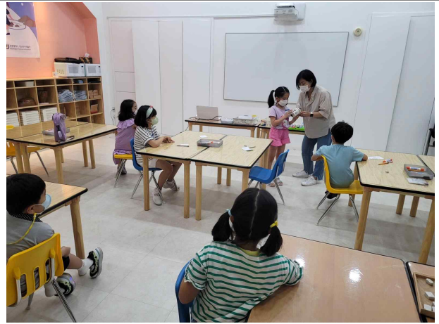
<내 손 안의 선사> 활동사진