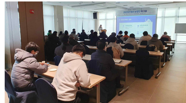
▲ 2022년 12월 13일 개최된 청년농업인 워크숍 교육사진]