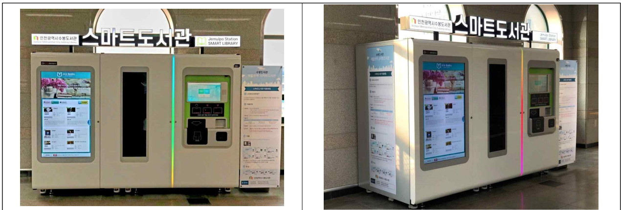
[사진] 제물포역 스마트도서관

한편, 앞서 지난달 15일 (주)공항철도 운서역에도 스마트도서관 「운서서가」를 개소한 바 있다.