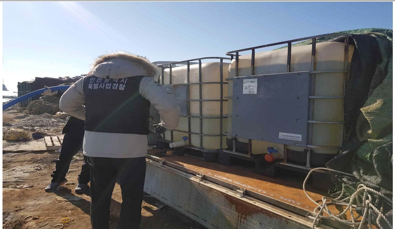
김 활성처리제 등 점검