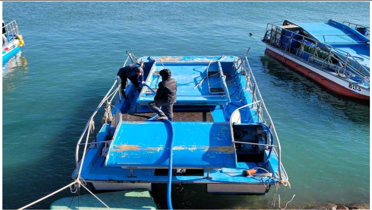
김 채취선 승선 조사·점검