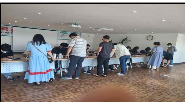
상품권 지급부스 (추석명절)