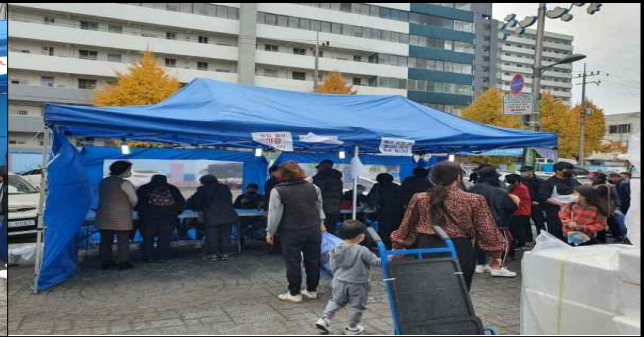
상품권 지급부스 (김장철)