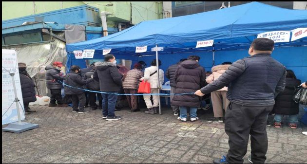
상품권 지급부스 (설명절)