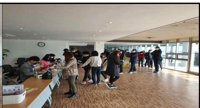
상품권 지급부스 (김장철)