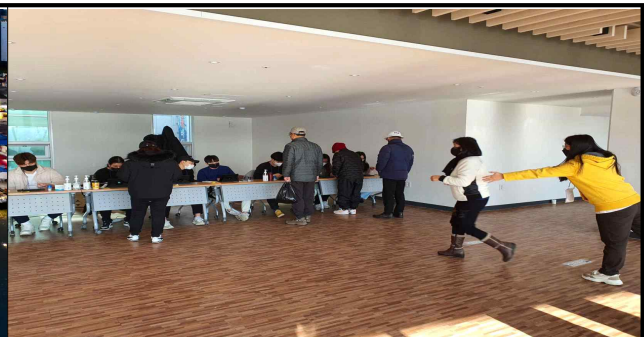
상품권 지급부스 (설명절)