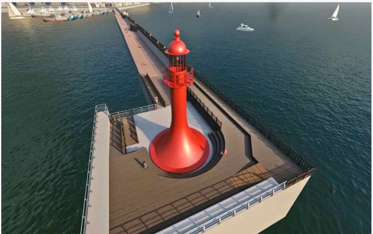
조 감 도