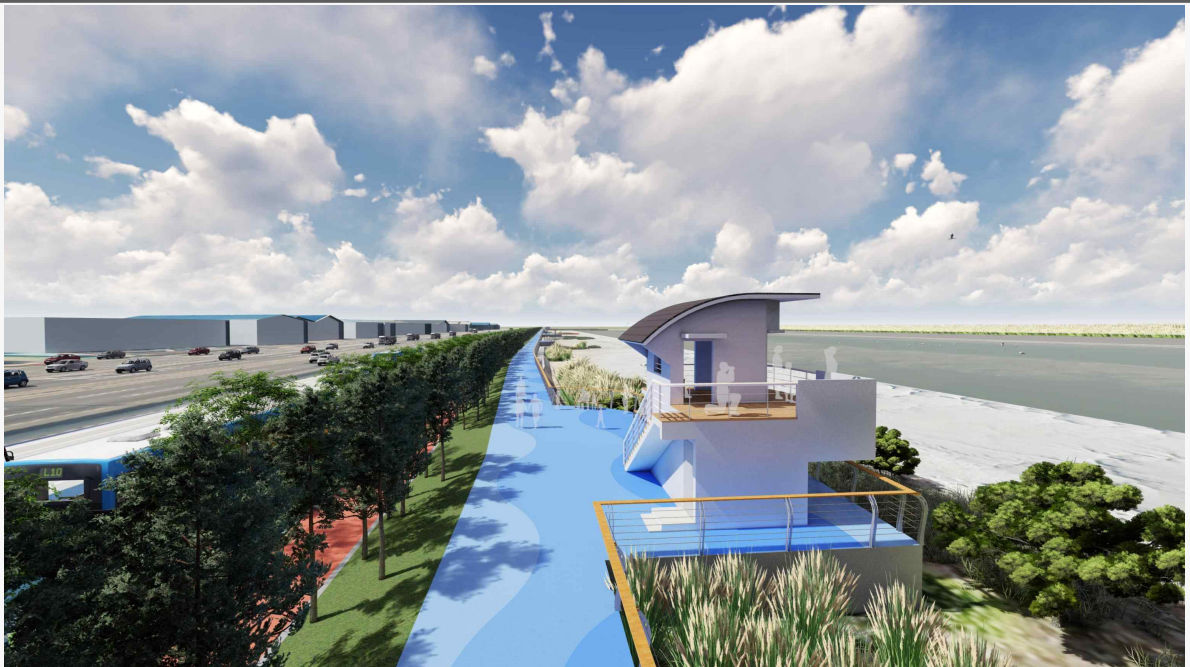
조 감 도