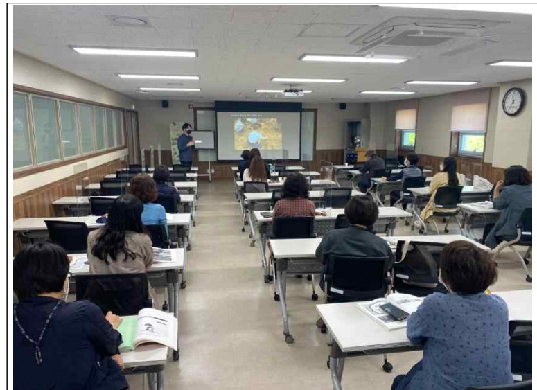
2022년 농촌교육농장 교사양성과정 운영 사진