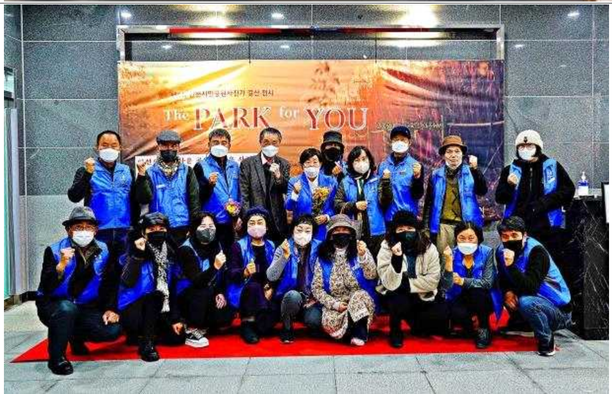
제5회 전시회, 청라블루노바홀 전시실 ('22.12.2.~12.9.)