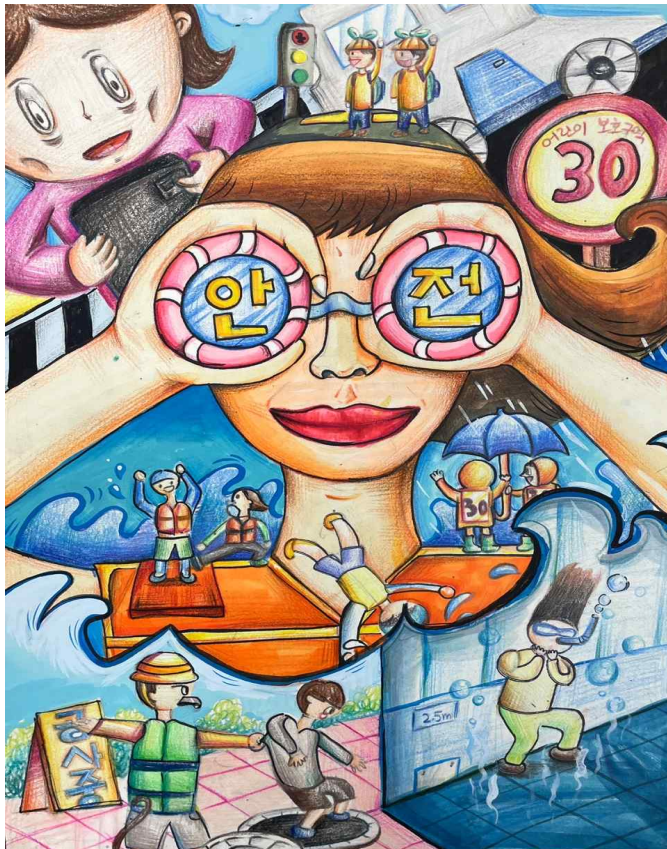
어린이 안전그림 그리기 공모전에서 대상을 차지한 임채규 어린이의 '우리들의 안전 지킴이'