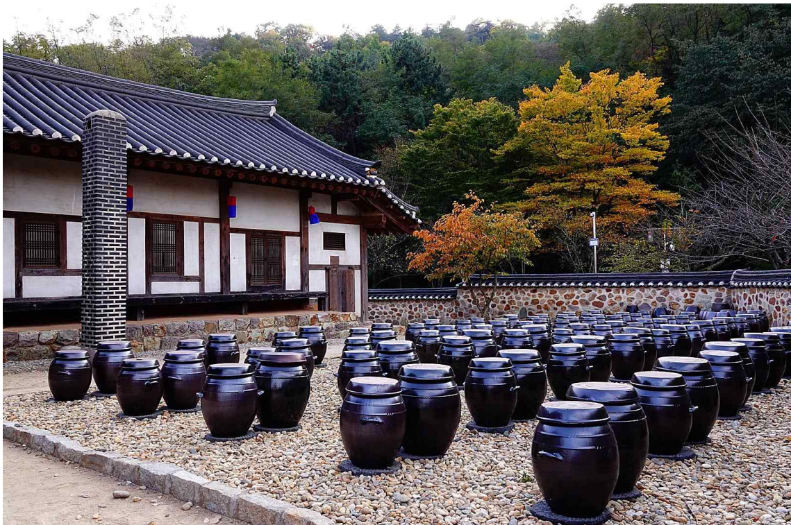
인천시민공원사진가 백운기 作