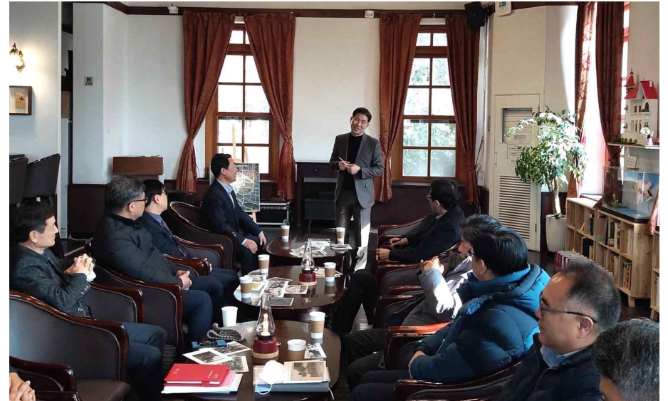
<참고자료> 2023년 토지·공간정보업무 추진계획