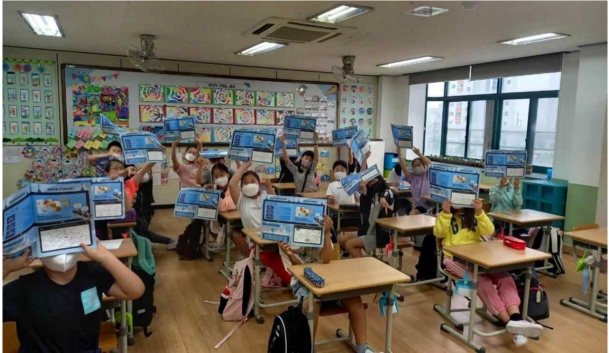
<2022.8.25. 후정초등학교 5학년 학생을 대상으로 한 찾아가는 자원순환 교실 >