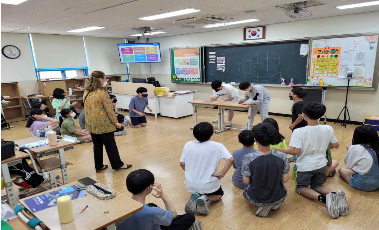
<2022.6.21. 정각초등학교 6학년 학생을 대상으로 한 찾아가는 자원순환 교실 >