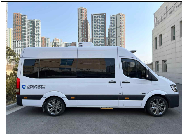
수산생물질병 방역차량 외부