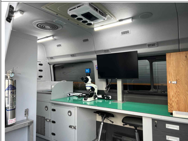
수산생물질병 방역차량 내부