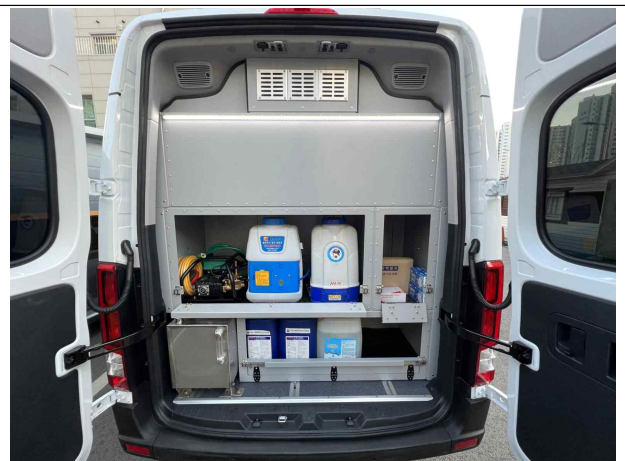
방역장비 및 의약품 적재함