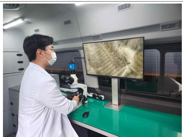
차량 내 현미경을 통한 검정