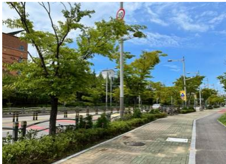
< 2022년 조성된 중구 삼목초등학교 자녀안심 그린숲 >