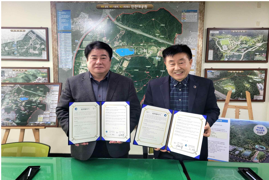
<인천대공원사업소와 허준-약초학당 업무협약 체결>