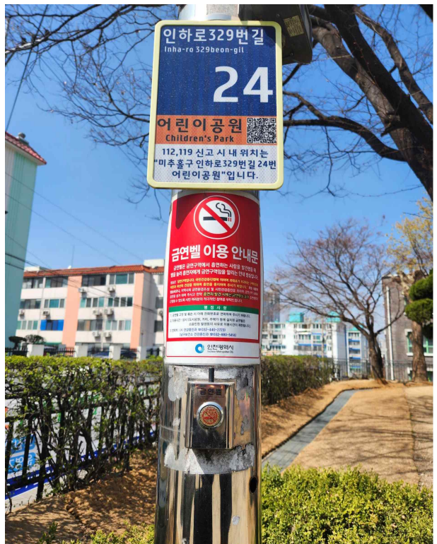
금연벨 전수점검·홍보 관련사진