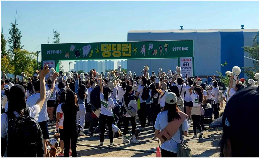
[관련사진 - 2022년 9월 송도달빛축제공원에서 열린 ‘댕댕런 2022’]