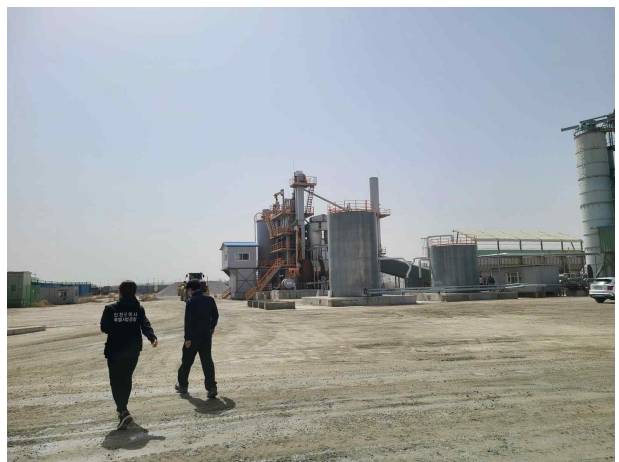
특사경 현장 조사중인 장면