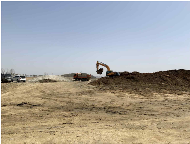
신기 공정 이동식살수정치 미비치