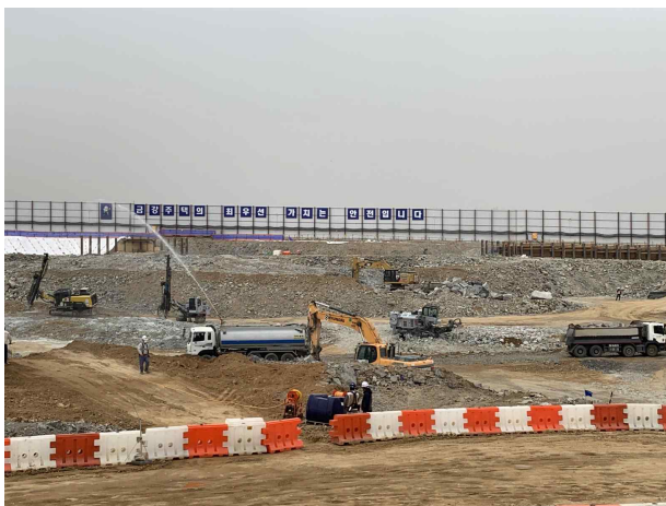
신기 공정 이동식살수정치 일부 미비치