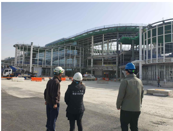
특사경 현장 조사중인 장면