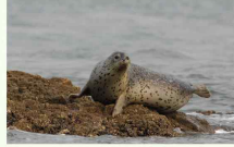
점박이물범(포유류) 문화재청 국가문화유산포털