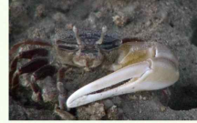
흰발농게(무척추동물) 원작 현진오 저작권 국립생물자원관