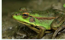
금개구리(양서류) 국립생태원 www.nie.re.kr