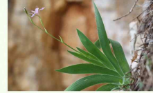
대청부채(식물) 원작 동북아생물다양성연구소, 저작권 국립생물자원관