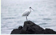
저어새(조류) 국립생태원 www.nie.re.kr

인천 지역의 생태, 지리, 사회, 문화적 특성을 반영하는 상징적인 생물로 보호해야 할 필요성이 있는 종을 말합니다.