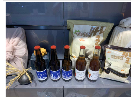
우리 쌀 수제맥주 완성