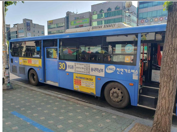
사진설명 : 대개체 설치차량 모습