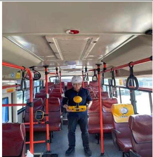
사진설명 : 버스 내부에서의 주요 지점별 전자파 정밀 측정 모습