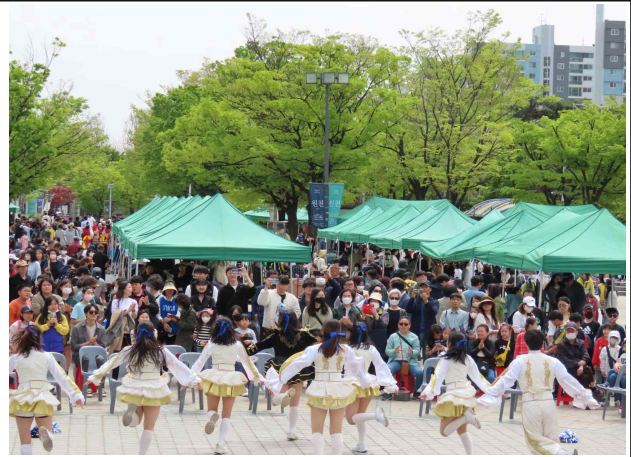
2023. 4. 22(토) 개장식 축하공연