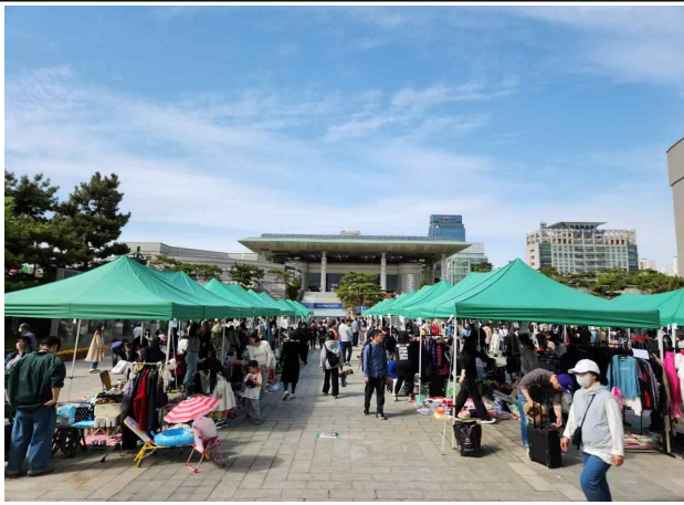
2023 4. 22.(토) 장터 운영 전경