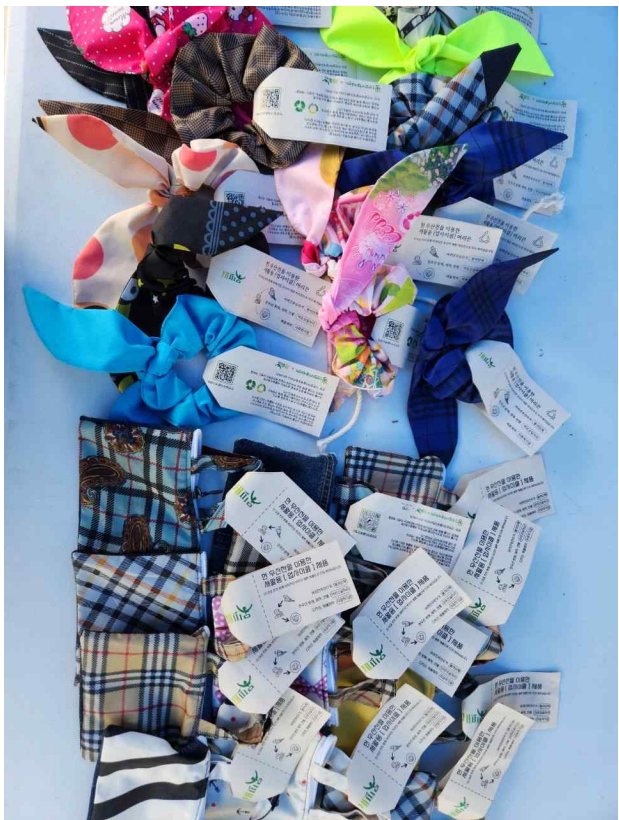
폐우산으로 제작한 머리끈, 동전지갑