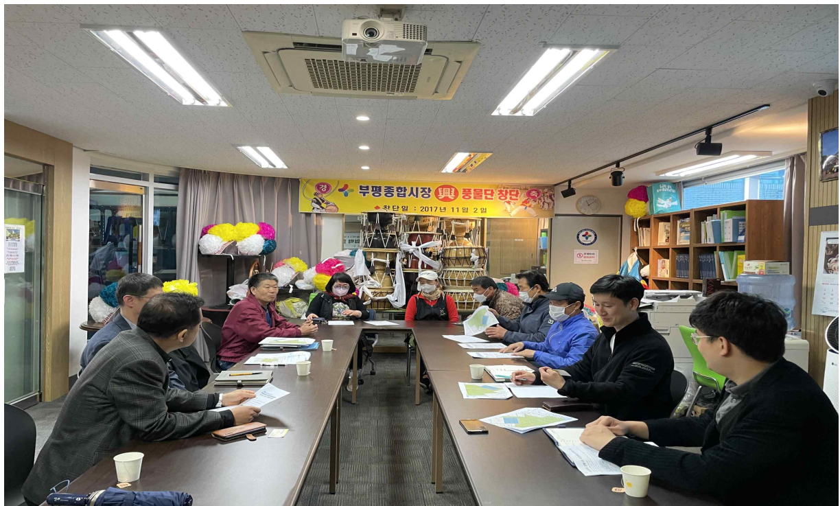
< 부평종합시장 상인연합회 실무회의 사진(23년 4월) >