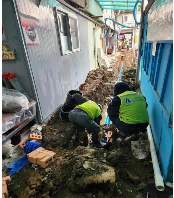
< 학익시장 노후관 정비공사 (23년 5월) >