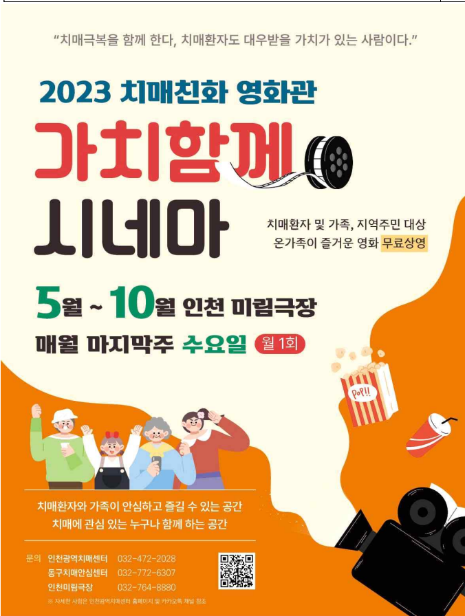
< 가치함께 시네마 포스터 >