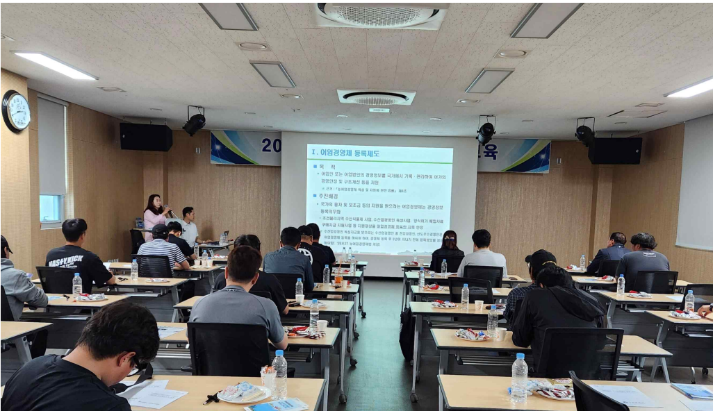
▲ 어업경영체 등록 교육