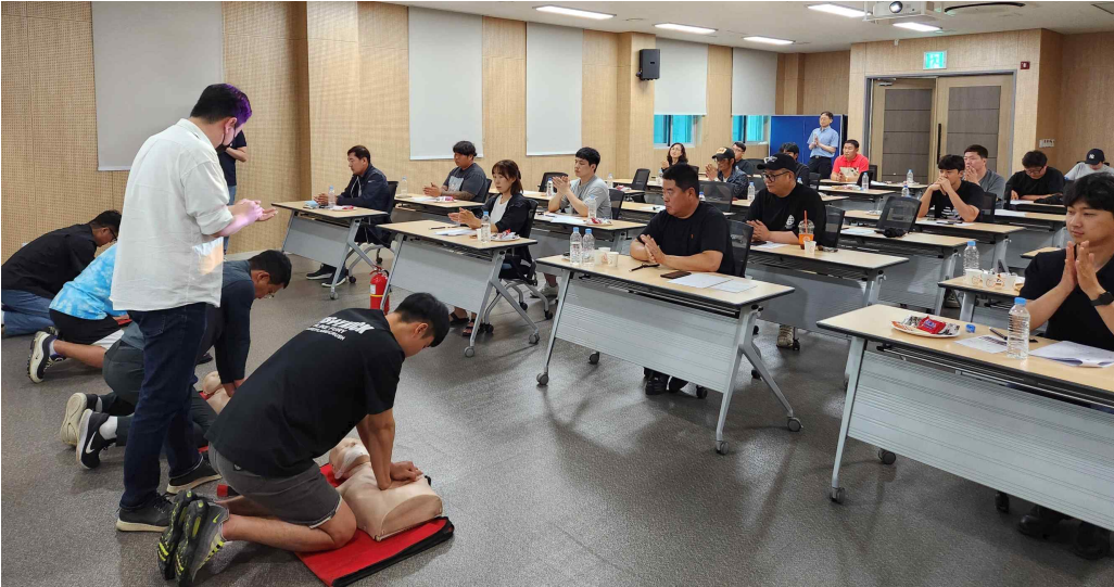
▲ 어업인 안전교육