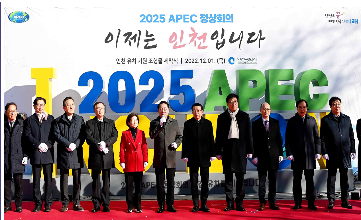
APEC 조형물 사진