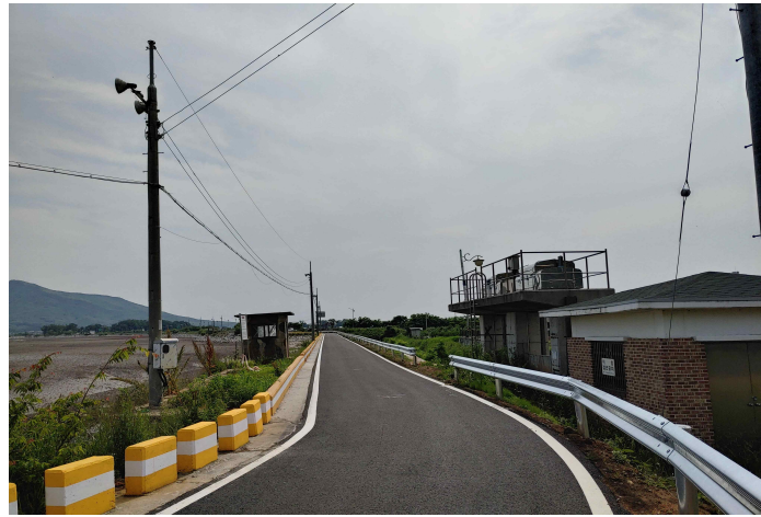
진입로 개선공사(해안연결로) (강화군 화도면 후포항)