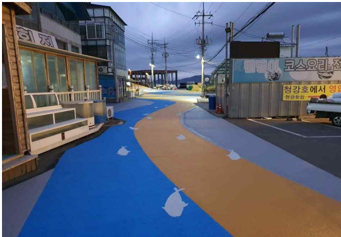
도막포장 완료 (강화군 화도면 후포항)