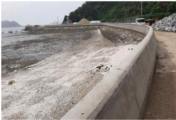
야달항 항내 연결도로 월파벽 송상완료 (옹진군 북도면 장봉리 야달항)