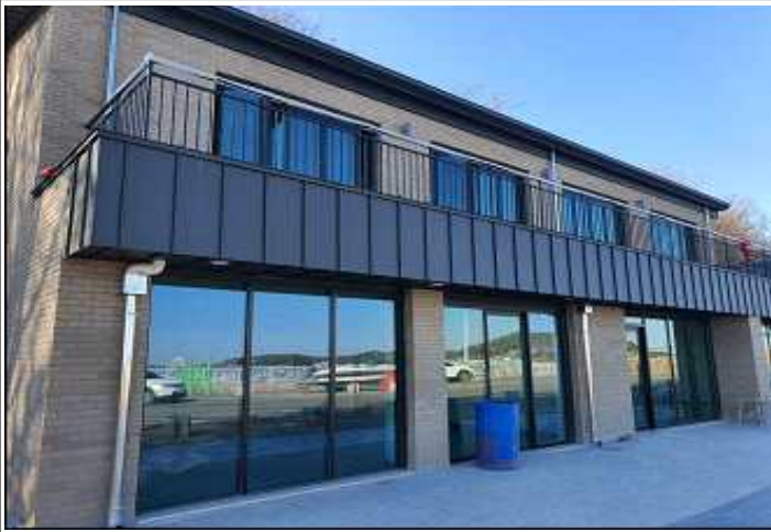
어촌체험마을 사무소 리모델링 (중구 무의동 대무의항 큰무리마을)