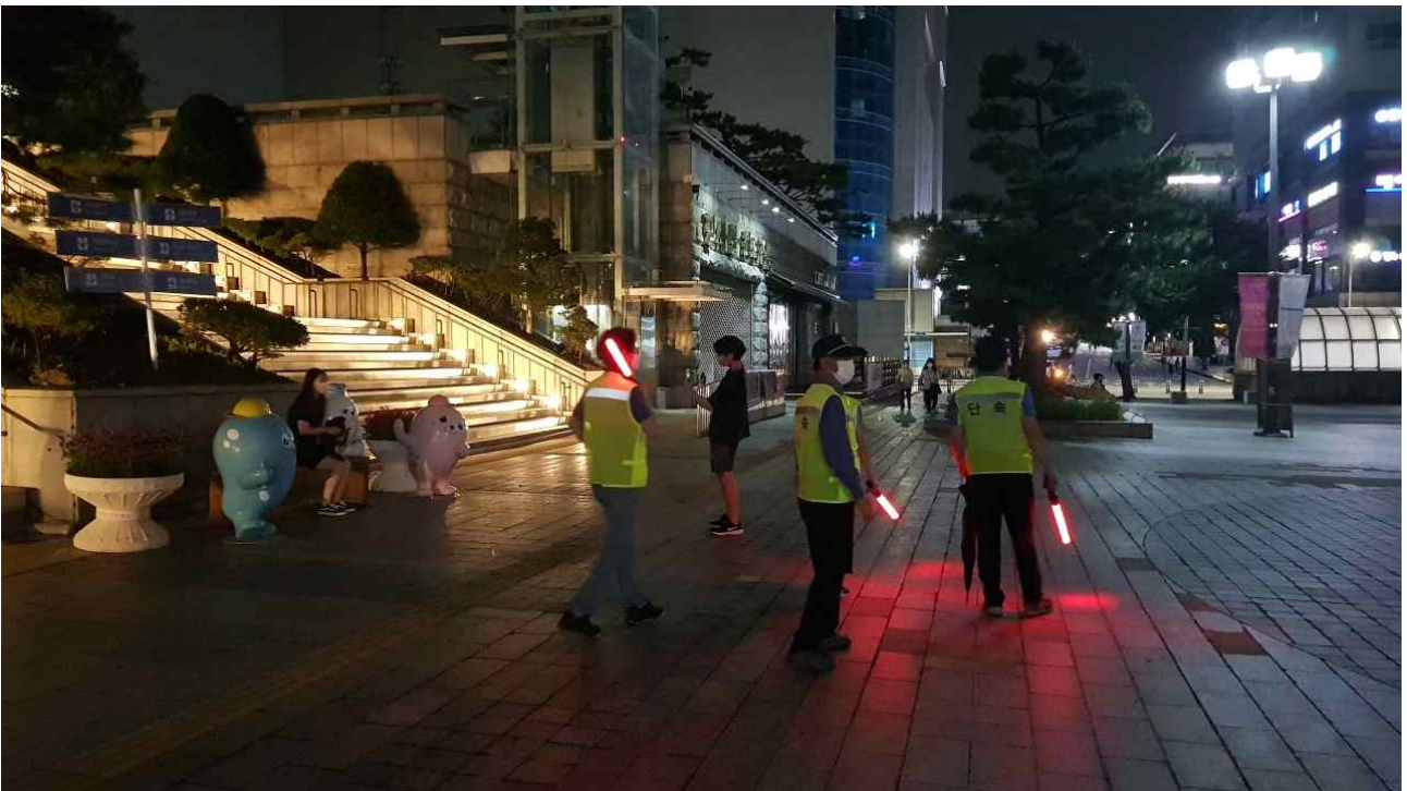
▶ 중앙공원(문화예술회관앞)내 야간 음주 및 취식행위 등에 대해 인천대공원 사업소와 자치경찰이 합동 단속