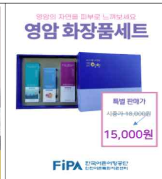
옹진군 영암 '해조화장품'