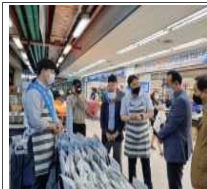
수산물 소비촉진 행사