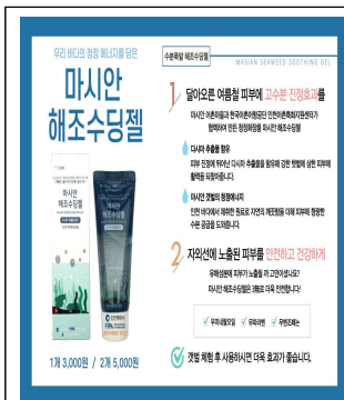
중구 마시안 '해조수딩젤'