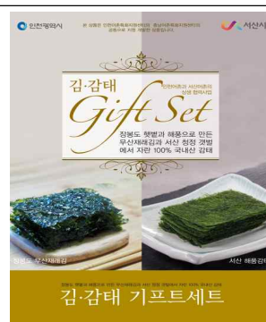
옹진군 장봉 '김·감태 세트'