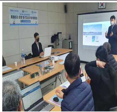
어촌마을 사후관리 모니터링