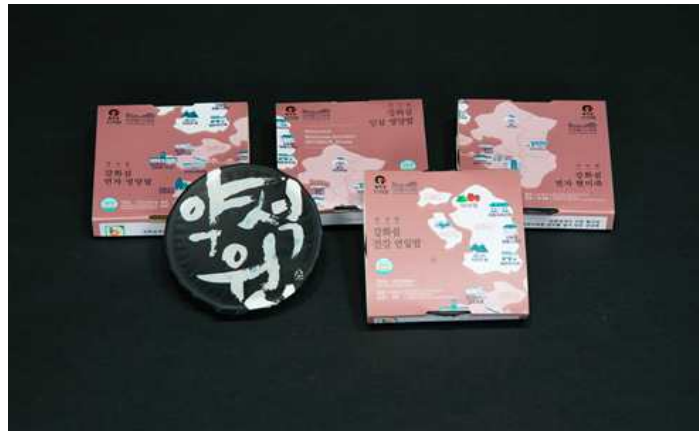
대상(인천웰니스 건강간편식 꾸러미)