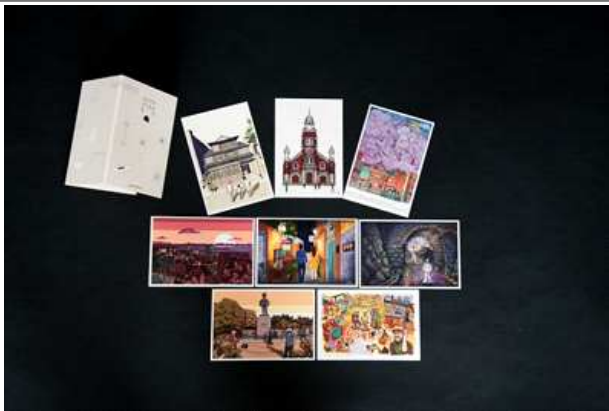
최우수상(동인천의 사사로운 풍경 엽서세트)