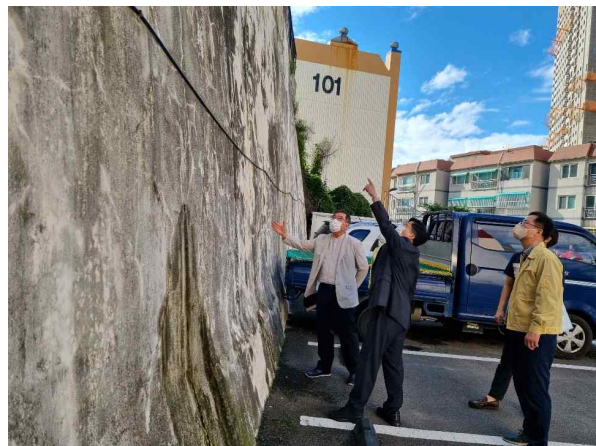
부평구 아파트 옹벽