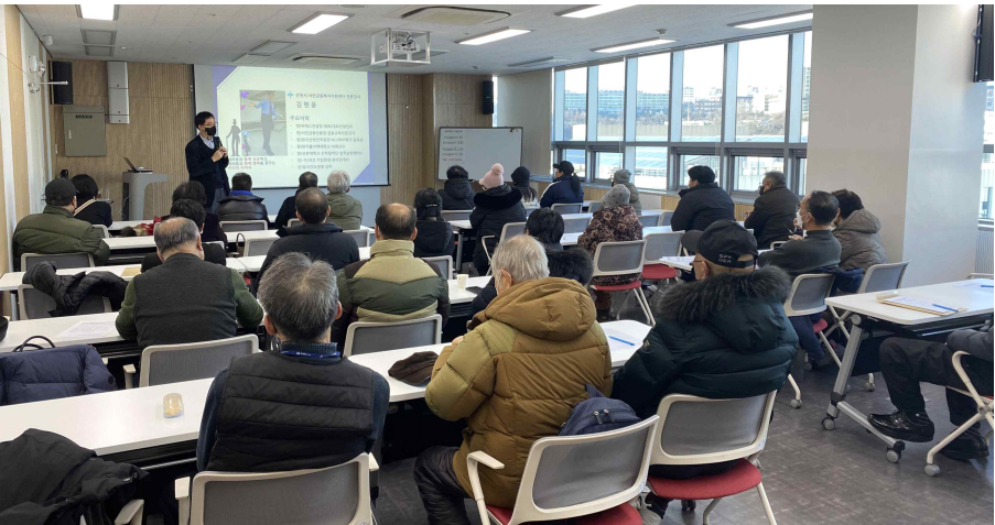
< 관련사진 >

시 소상공인정책과장은 “코로나19, 금리인상, 인플레이션 등으로 경제적 한계에 이른 소상공인 및 금융소외계층들이 채무조정과 맞춤형 교육을 통해 경제적으로 재기할 수 있는 계기가 되기를 바란다” 고 말했다.