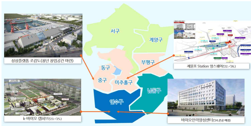
<주요 창업인프라 조성계획 현황>